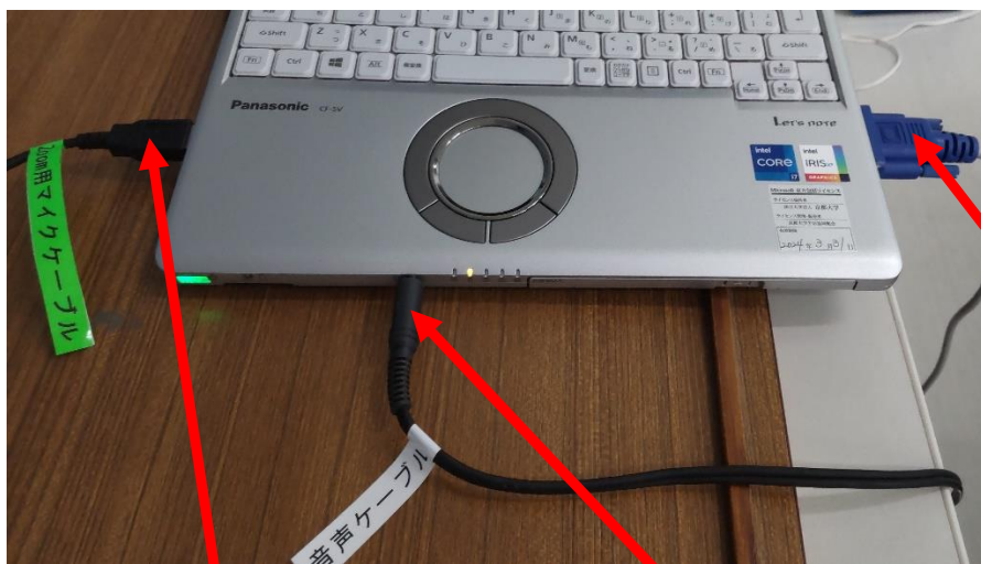
Zoom 用マイクケーブル