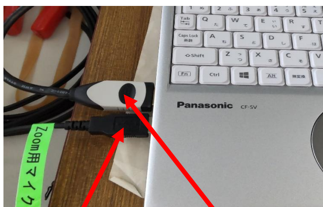
Zoom 用マイクケーブル